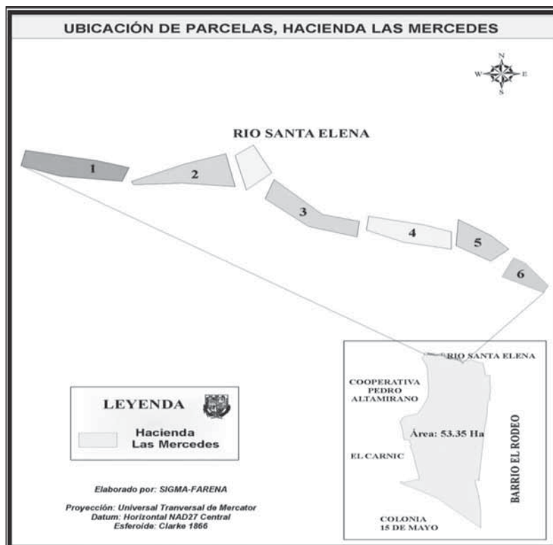
Figura 1. Diseño de la Plantación arbórea establecida en la ribera Presa Los Sábalos. UP-HLM. Managua, 2007.

Dos semanas después de establecida la plantación, se inició el primer levantamiento de los datos dasométricos (altura - cm y diámetro basal - mm); después se realizó de forma mensual, durante seis meses. La altura (cm) de cada planta se midió, desde la base, hasta el ápice de cada planta, utilizando una cinta métrica. El diámetro basal (mm) se midió a ras del suelo de cada planta utilizando un vernier. Para calcular el incremento medio mensual alcanzado por las especies en 6 meses desde su establecimiento, se utilizó la metodología propuesta por el CATIE (2001): I = M2 - M1 (I: Incremento medio men-