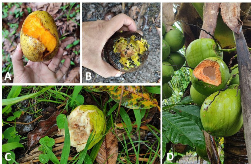
Figura 3. Frutos mordidos por ardilla. A) Mango ( Mangifera indica ); B) Aguacate ( Persea americana ); C) Guayaba ( Psidium guajava ); D) Coco ( Cocos nucifera ).

Varias especies fueron mencionada solamente una vez, entre ellas: Coco ( Cocos nucifera ), pijibay ( Bactris gasipaes ), mamón chino ( Nephelium lappaceum ), guineo yute ( Musa sp), higuérón (desconocido), guabillo ( Inga sp), helequeme ( Erythrina sp), pitahaya ( Hylocereus undatus ), guaba paterna ( Inga sp), guaba caite ( Inga sp), chaperno ( Lonchocarpus sp), espabel ( Anacardium excelsum ), corozo (desconocido), palma africana ( Elaeis guineensis ), granadilla montera ( Passiflora sp), cacao montero ( Theobroma sp), palo de hule ( Castilla elastica ) y palmita (desconocido). Algunos productores, resaltaron especies de árboles frutales específicamente para algunas especies de fauna silvestre que se alimenta del cacao, por ejemplo, fue mencionado con frecuencia para ardilla: guayaba, aguacate y mango; para pájaro carpintero: papaya montera; para mono: Guaba, zapotemico, almendra ( Terminalia catappa ), mango, chilamate, papaya montera, capirote y chaperno (los nuevos brotes [hojas tiernas]). En las observaciones de campo, fueron encontrados frutos de algunas especies de plantas, mordidos por ardillas (Figura 3).